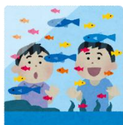
マリンピア日本海

2日間とも天候に恵まれ、みんなで元気に活動することができ、笑顔いっぱいの修学旅行になりました。