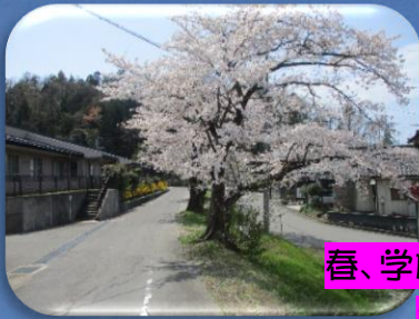
春、学校周辺の花をさがしに さんぽしました。