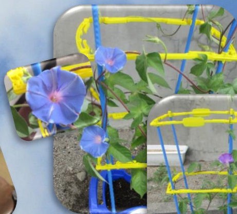
まいにちの水やりをがんばりました！