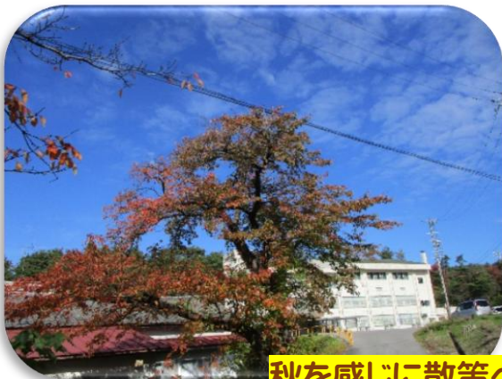
秋を感じに散策へ