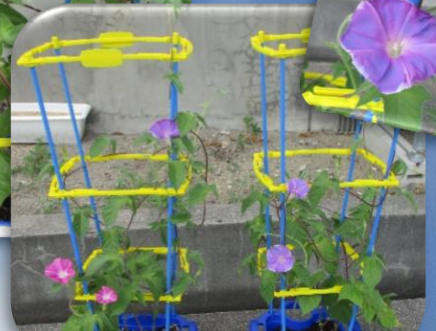
夏休み前、朝顔が咲きました！