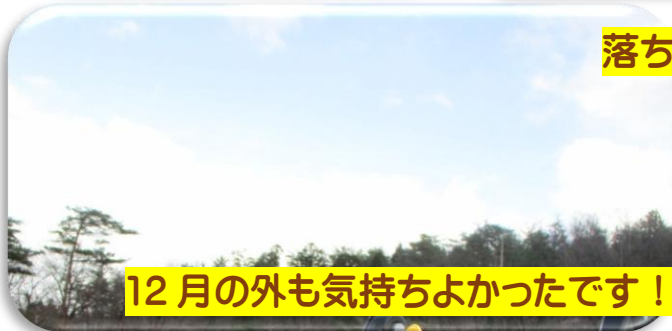
12月の外も気持ちよかったです！