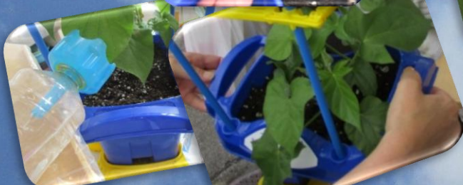
朝顔を植えました！芽や葉っぱ、つるがのびてきました！