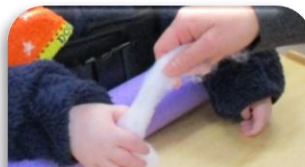
わたを引っ張ります！