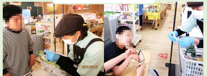
おかね、どうぞ！ やりていが、楽しい～♪