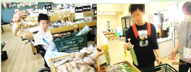
じゃがいも、あった！ このアスパラがいいな♡