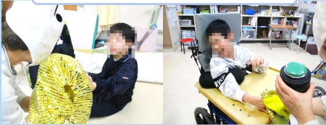
キラキラ…さわりたい… くっついてはなれない！