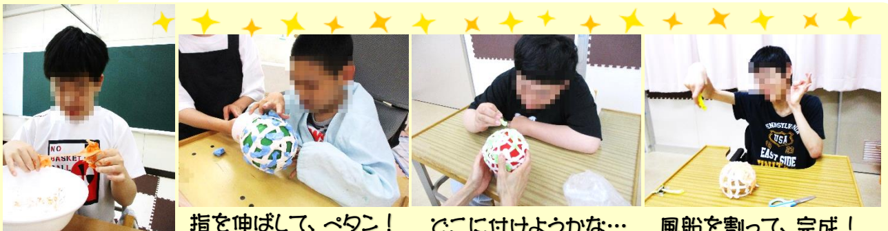
指を伸ばして、ペタン！ どこに付けようかな… 風船を割って、完成！