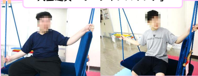
か～ら、か～ら！ ブランコ遊び、楽しい～♪