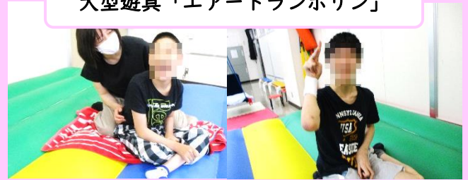
あぐら座でもへっちゃら！ 余裕のピース★